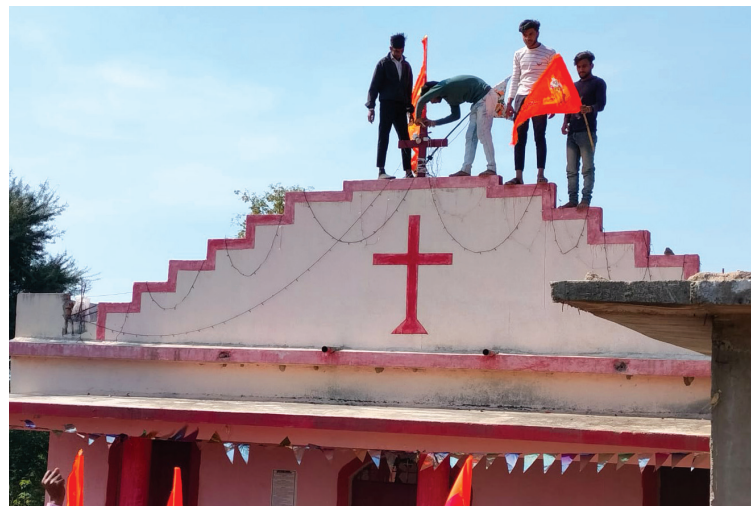
Los radicales hindúes con sus banderas naranjas retiran la cruz de una iglesia.