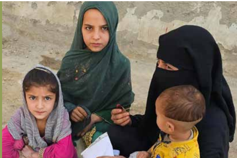
La familia recibió ayuda alimentaria a través de un colaborador de ICR. ICR no muestra imágenes de cristianos por su seguridad.

Los peligros específicos que enfrentan los creyentes afganos difieren de una ciudad a otra y de una provincia a